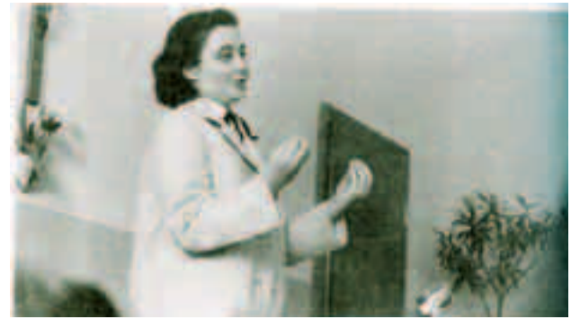
Una giovanissima Lubich mentre illustra il suo ideale

I POLITICI PER L'UNITÀ Il confronto comincia con l'incontro del '96 a Napoli tra Chiara Lubich e una trentina di politici