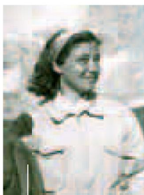
Una giovane Chiara Lubich durante una gita in montagna negli Anni 40. Gli anni in cui fondò il movimento dei Focolari

dei focolarini, attualmente presenti in 182 Paesi, 89 dei quali con centri stabili, così distribuiti: Europa (29), Africa (25), America (19), Asia (13), Oceania (3). I membri effettivi sono 141 mila, gli aderenti e i simpatizzanti oltre due milioni. Per muoversi bene in www.focolare.org c'è un comodo motore di ricerca interno. L'accessibilità non è impeccabile.