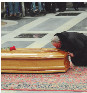
Coordinamento giornalistico: Augusto Goio

E' un compito non scontato, ma possibile a tutti, dentro un respiro di Chiesa. Nel videomessaggio che ha concluso i funerali, Chiara se ne diceva convinta, per nulla spaventata: "Altri dopo di me lo porteranno avanti..."